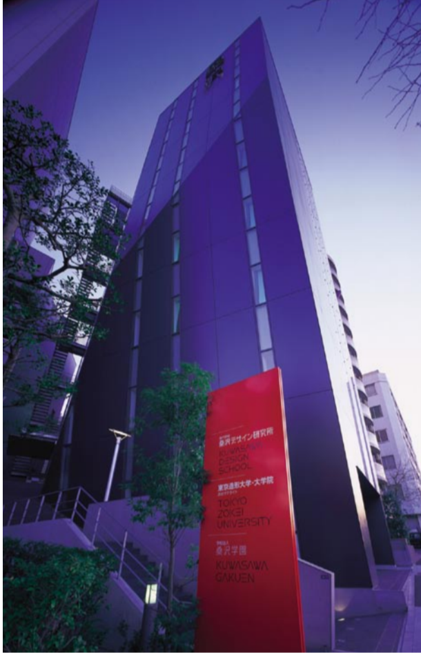
桑沢デザイン研究所校舎